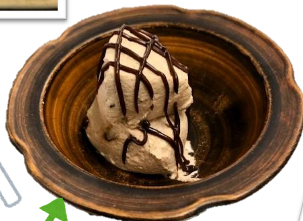
ミキサー・ゼリー食 デザート